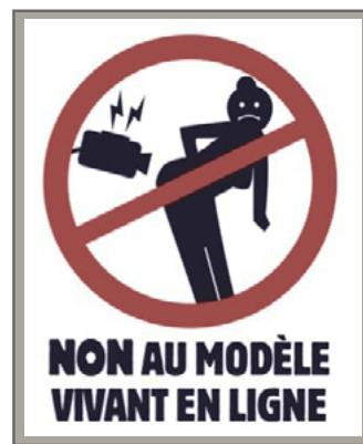
Illustration: Gwenaél Houarno

Au vu des obligations légales du RGPD et de l'article 9 du code civil, ce mode de transmission n'est pas acceptable. Le corps nu reste l'outil de travail du ou de la modèle, continuons d'interdire l'utilisation de la photo et de la vidéo en salle de cours, ainsi que l'enregistrement et la captation d'images avec retransmission.